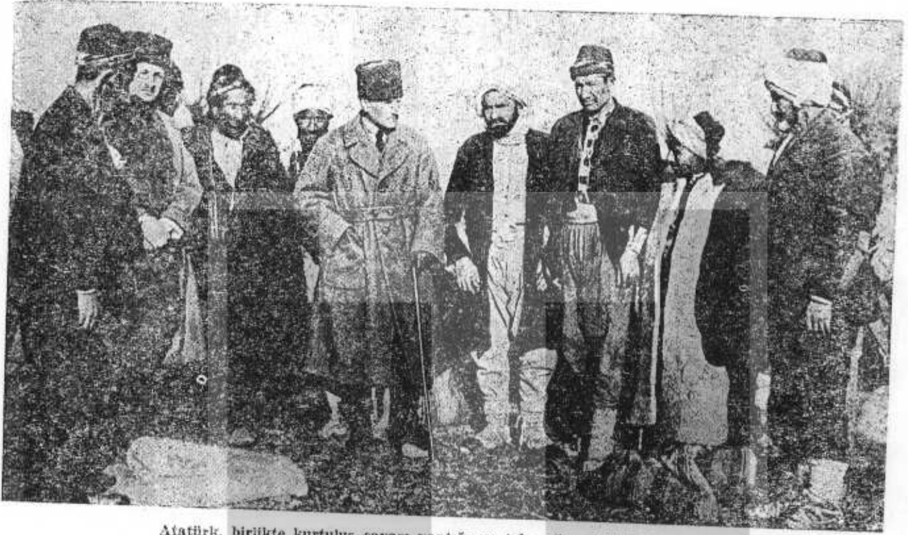
Atatürk, birlikte kurtuluş savaşı yaptığı ve tek güvendiği halkla bir arada

vaşları, sömürgecileri temizledikten sonra, iç değişimlere yönelir, halkçı bir devrimin uyguladığı değişimlerde «bir toplumsal adalet» özü vardır. Benim savaşım, toplumcu Atatürkçülerde çeşitlenir : Bir toplumsal adalet savaşına döndüğü. Bu devrimin doğal gelişimidir. Halkın kurtuluşuna yönelmiş bir devrim, toplumsal adalet ilkesinde özünü bulur. Ama iki sevgili ilkemi, devrimin hayat toprağını unutmayın : Bağımsızlık ve halk egemenliği.