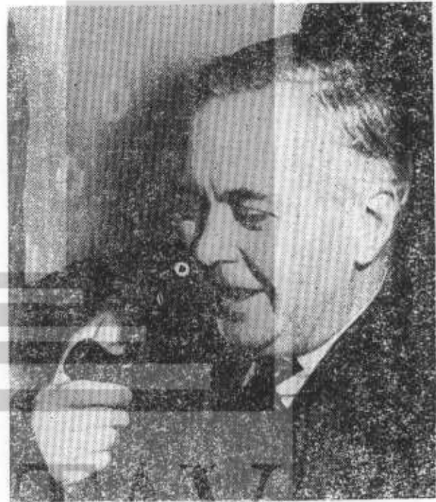
HAROLD WILSON (İşçilerin zaferi)

Seçim sonuçları belli olur olmaz, bir takım nüfuzlu çevreler İşçilerin 5 üyelik çoğunlukla İktidarda sürekli kalamayacağı kanısını yaymaya başladılar. Bu çevrelerden yayılmak istenen gerçek fikir şu idi : İşçi Partisi'nin, Avam Kamarasındaki küçük çoğunlukla çelik sanayiinin devletleştirilmesi gibi ihtilâflı meseleleri geçirmesi (Lordlar Kamarasındaki direnme de dikkate alınmırsa) imkânsızdır. Buna karşılık İktidar, aşağı yukarı bütün partilerin prensip olarak anlaştıkları etütin, mesken, ödemeler dengesi, ekonomik büyüme meseleleri